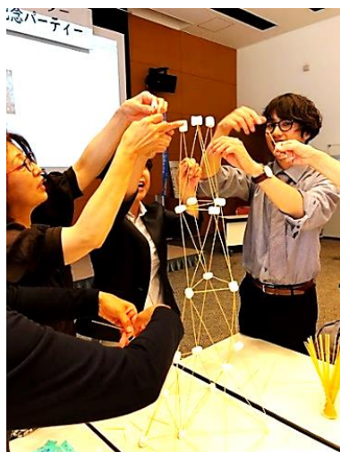
大いに盛り上がった 「マシュマロタワー」